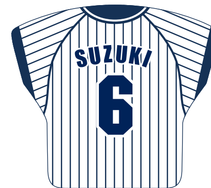
仕上がりイメージ